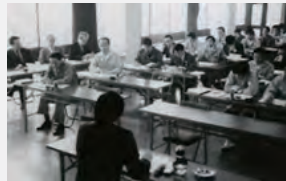
昭和63年度技術研修会（県営繕課）