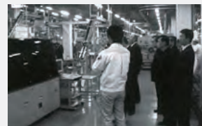
平成16年度県外技術研修会（松下電工津工場）