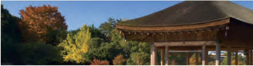
奈良電業協会 役員名簿