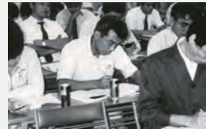
平成2年度技術研修会（県電工組）