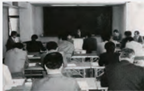
昭和62年度技術研修会（住都公団）