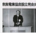
左：奈良電業協会設立発会式 右：松田会長挨拶