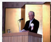
左：設立20周年記念式典 右：山口会長挨拶