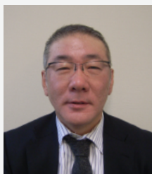
一般社団法人 奈良電業協会 会長