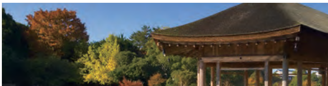
奈良電業協会 役員名簿