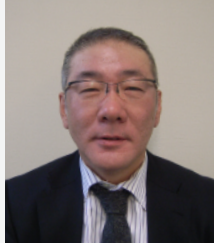
一般社団法人 奈良電業協会 会長