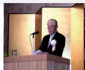
左：設立20周年記念式典 右：山口会長挨拶