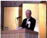
左：設立20周年記念式典 右：山口会長挨拶