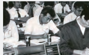
平成2年度技術研修会（県電工組）