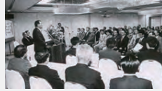
奈良電業協会10周年式典