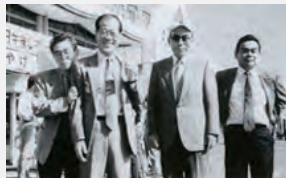
平成3年度県外技術研修会（東芝三重工場）