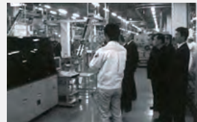
平成16年度県外技術研修会（松下電工津工場）