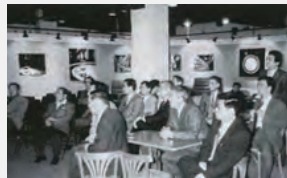
平成4年度県外技術研修会（サントリー山崎工場）