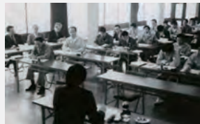
昭和63年度技術研修会（県営補課）