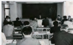
昭和62年度技術研修会（住都公団）