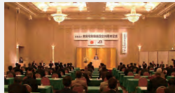
奈良電業協会20周年記念式典